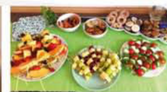
Tag der offenen Türen